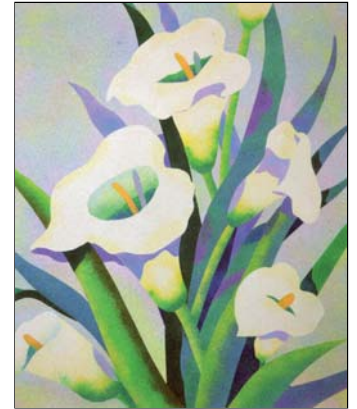
Ref. PRD-39 38x46 cm (8F)