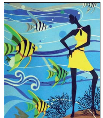
Ref. PRD-46 50x61 cm (12F)