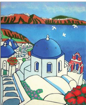
Ref. PRD-47 50x61 cm (12F)