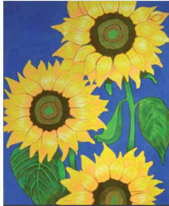
Ref. PRD-42 50x61 cm (12F)