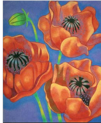
Ref. PRD-44 50x61 cm (12F)