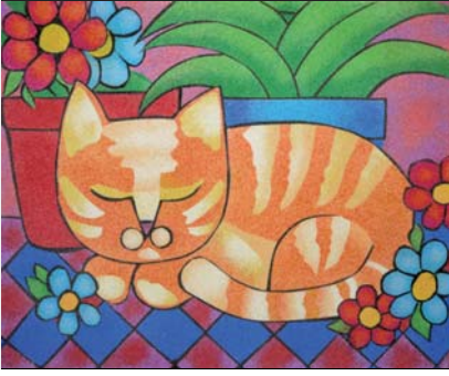
Ref. PRD-51 46x38 cm (8F)