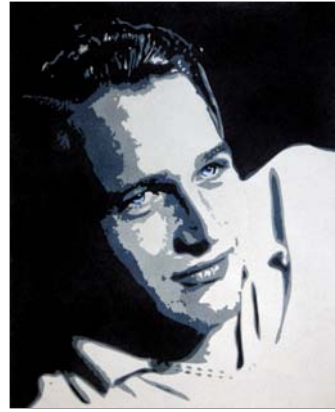
Ref. PRD-36 50x61 cm (12F)