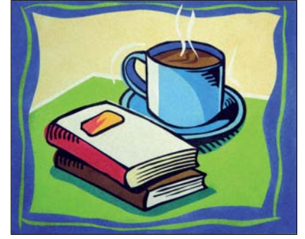
Ref. PRD-62 46x38 cm (8F)