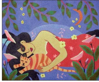
Ref. PRD-55 46x38 cm (8F)