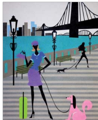
Ref. PRD-45 50x61 cm (12F)