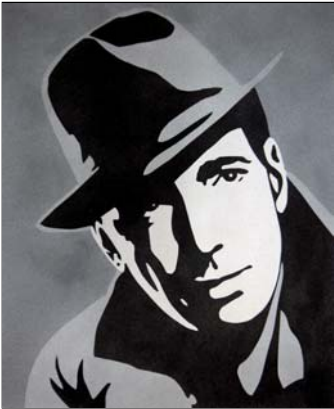
Ref. PRD-38 38x46 cm (8F)