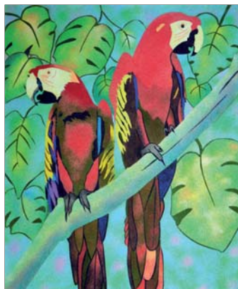
Ref. PRD-56 50x61 cm (12F)