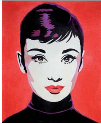
Ref. PRD-34A 50x61 cm (12F) Ref. PRD-34B 38x46 cm (8F)