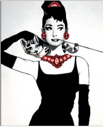
Ref. PRD-05 50x61 cm (12F)