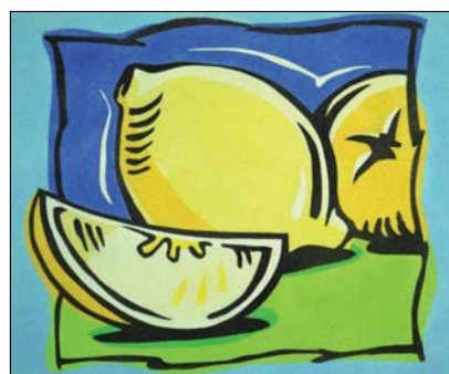
Ref. PRD-61 46x38 cm (8F)