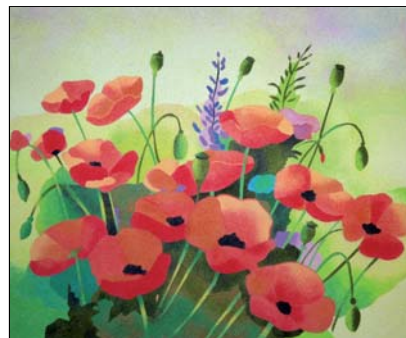
Ref. PRD-41 61x50 cm (12F)