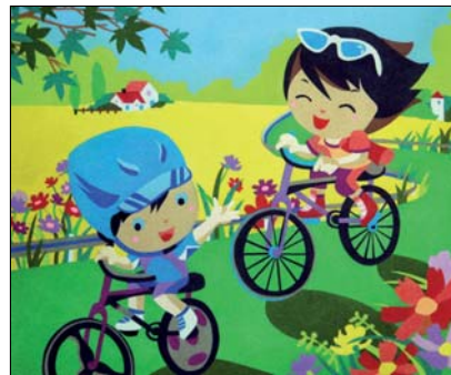
Ref. PRD-49 61x50 cm (12F)