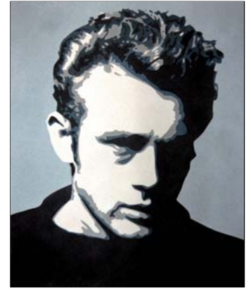
Ref. PRD-37A 50x61 cm (12F) Ref. PRD-37B 38x46 cm (8F)